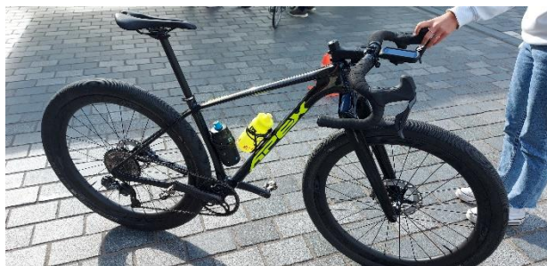
Figuur 2: Toegestaan stuur