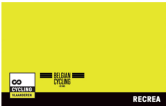
Voorbeeld recreatief lidmaatschap Cycling Vlaanderen

Niet-vergunninghouders (recreanten – mannen en vrouwen) kunnen deelnemen aan deze wedstrijden. Zij zullen steeds opgenomen worden in de einduitslag.