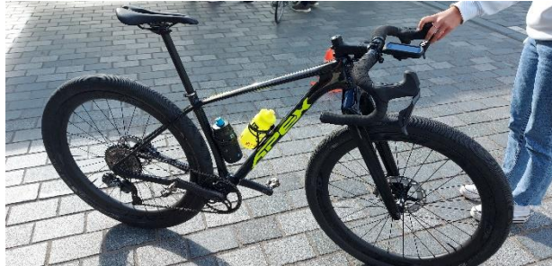
Figuur 2: Toegestaan stuur