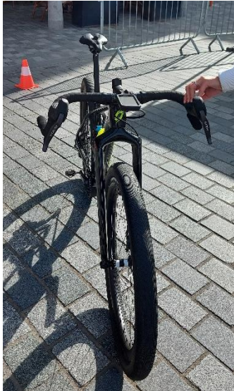
Figuur 1: Toegestaan stuur

Er mag gereden worden met een recht mountainbikestuur (zonder opzetstukken of armsteunen) of een speciaal strandracestuur, wat half gebogen is.