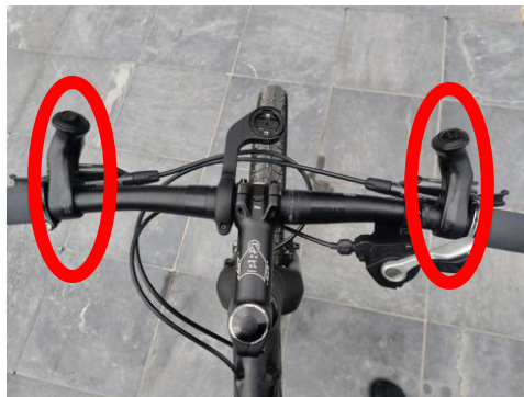
Figuur 3: Niet toegestaan stuur